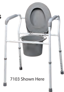
7103 Shown Here