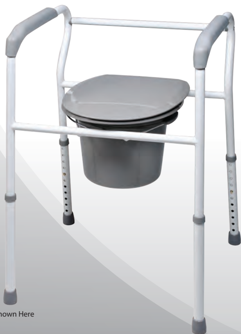
7103 Shown Here

Colección Plateada Inodoro de Acero Tres-en-Uno Items 7103 & 7103A-4