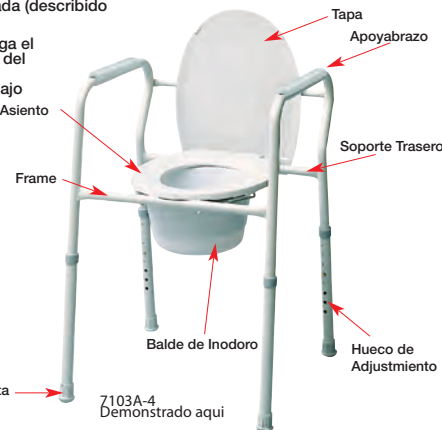
7103A-4 Demostrado aqui